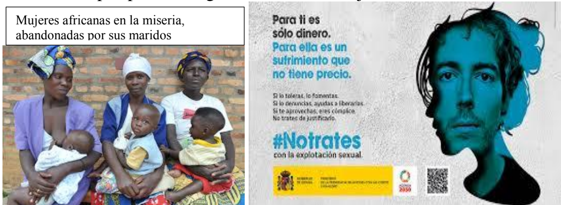
Mujeres africanas en la miseria, abandonadas por sus maridos

Sus mismos cuerpos ya son objeto de negocio como medio de ganarse la vida o simplemente comer, especialmente para las mujeres más empobrecidas. En un país africano tuvimos conocimiento de barrios muy pobres que todos los días por la mañana las madres les dicen a sus hijos: “niños portaros bien, que yo marcho a ‘trabajar’”. Es decir, a vender sus cuerpos en el mercado de los hombres, porque aquellas mujeres, abandonadas de sus maridos, se ven obligadas a vender el uso de sus mismos cuerpos para dar algo de comer a sus hijos.