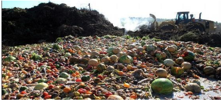
Comida a la basura

6.-NEOLIBERALISMO EROTICO: EL liberalismo económico no ha dejado nada que no haya tocado, y todo lo ha echado a perder, con la pasividad e indiferencia de muchos gobiernos. Nos estamos quedando sin partidos políticos y sin los políticos correspondientes con visión de futuro y compromiso con la Humanidad y el Planeta en que vivimos, pues todos sucumben ante el poder absoluto del dinero, cada vez más concentrado en menos manos.