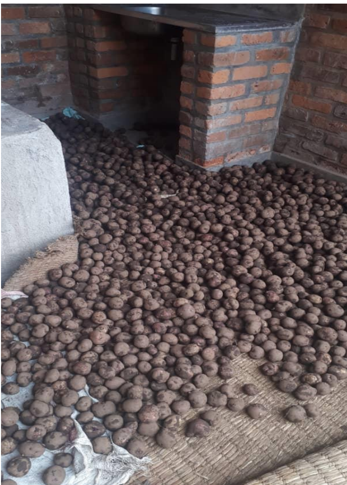
Patatas ya cosechadas y hortalizas en un terreno alquilado, que van a poder seguir alquilando y cultivando, gracias a cuantos colaboráis con los proyectos de Ruanda de las Misioneras de los SS.CC. que han optado por seguir a Jesucristo haciendo lo que El hizo, al que le preocuparon sobre todo dos cosas: la salud y la alimentación de la gente. “he venido para que todos tengan vida y vida en abundancia”.