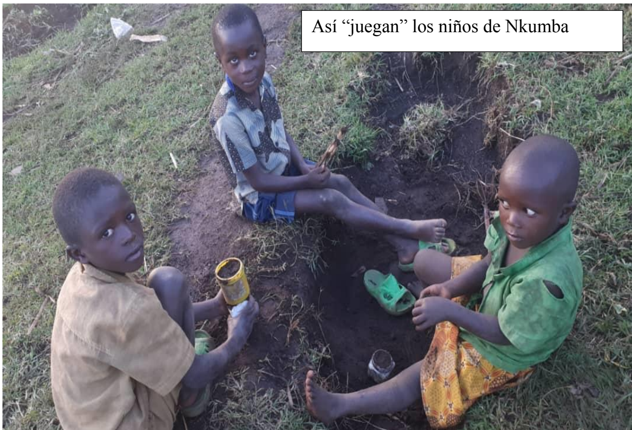
Así “juegan” los niños de Nkumba