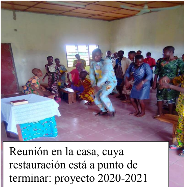
Reunión en la casa, cuya restauración está a punto de terminar: proyecto 2020-2021