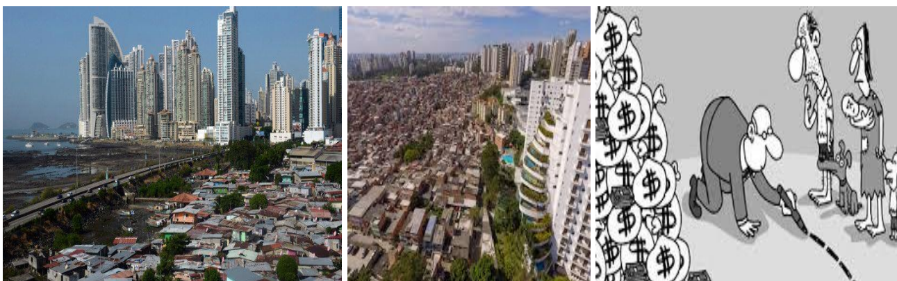
Imágenes que hablan por si solas

- El IDH (Indice de Desarrollo Humano) de Itiúba es tan solo del 0,544, uno de los Municipios más pobres del Estado de Bahía, y de Brasil en general, que tiene un IDH de 0,765. El problema se agrava porque hay una gran desigualdad social en el país, y en particular en Itiuba, pues en este Departamento el IDG (Indice de Gini) es de 0,533, que, según la ONU, un coeficiente de Gini superior a 0,400 es alarmante, ya que esto indica una insoportable realidad de desigualdad y de polarización entre ricos y pobres, siendo caldo de cultivo para el antagonismo entre las distintas clases sociales pudiendo llevar a un descontento y agitación social importante, incluso con riesgo de vidas humanas.