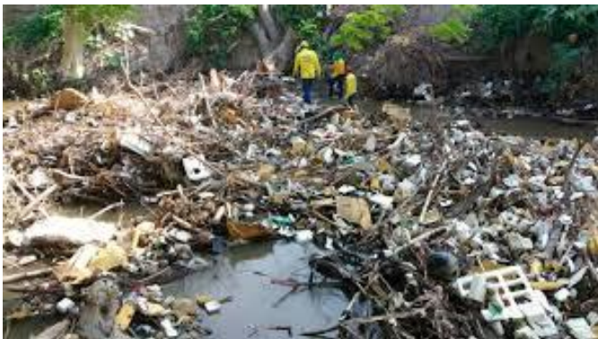
Basura en los ríos

-PARA CUIDAR DEL MEDIO AMBIENTE en la limpieza de montes, ríos, lagos y mares.