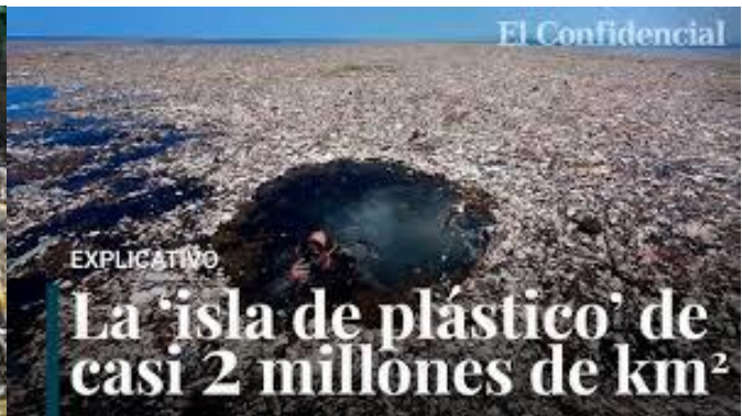
Basura en el Pacífico