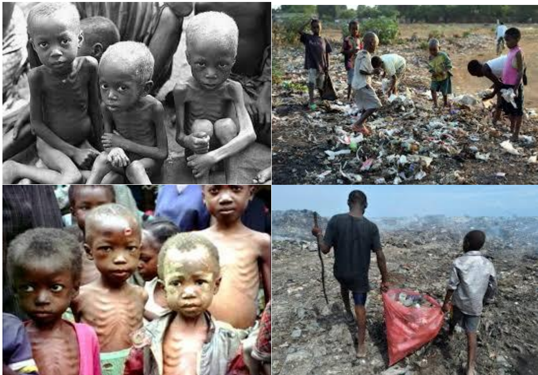
Viviendo de la basura

Los verdaderos CRISTOS Y VIRGENES de hoy son CRISTOS VIVOS de carne y hueso, no son de madera, ni de oro, ni de plata. Son CRISTOS VIVOS que no están en esas procesiones, imágenes y carrozas. Hay que buscarlos en otra parte.