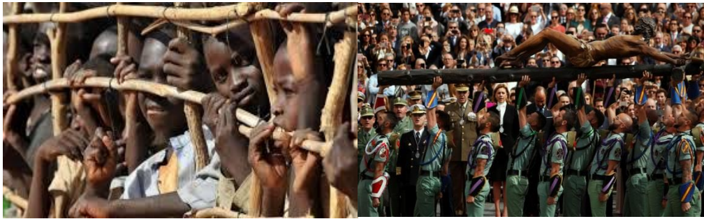
Inmigrantes en Libia

están seguras de que van a ser violadas, tratadas como un amasijo de carne. (De información facilitada por la CNN y Amnistía Internacional).